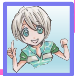
私はキャリーちゃん by「漫画でわかる中央キャリアネット」より

派遣就業というとなんなイメージでスタートされる方もいらっしゃる事も気付かされました。