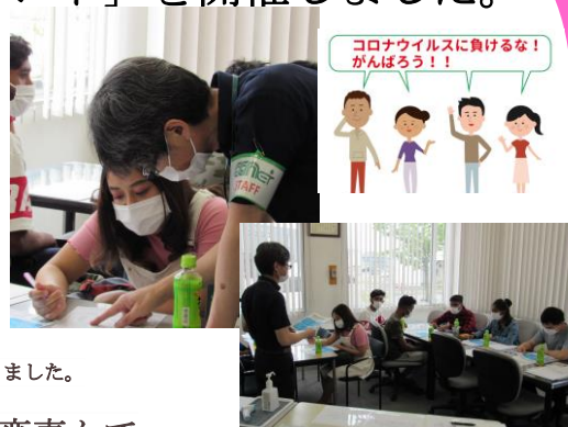
「生活応援イベント」の風景

新型コロナウイルスの影響によりアルバイトの中止や新たに仕事を見つける事が出来ていない留学生さんが増えており、弊社では6月6日（土）に留学生さん向けの「生活応援イベント」を開催致しました。