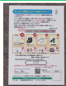
<個人宛送付済みのハガキ>

既にスタッフさんのお手元にはご案内のハガキが届いているかと思います。1等の空気清浄機をはじめ沢山の景品を準備しています。