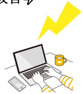
屋内にいても雷は危険!!

雷が鳴っている事に気付いたらすぐにシャットダウンしましょう。停電や落雷によるPCの電源ダウンに伴うデータの消失・ハードディスクの損傷を防ぎます。