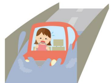
豪雨時は水溜まり走行に注意!!

高架下や立体交差のアンダーパスなど周囲より低い水溜まりの場所を走ると車が冠水・浸水する危険があります。最悪の場合マフラーなどから水が浸入してしまいエンジンが停止、そのまま立ち往生という状況となる場合があります。こういった場所はなるべく避けて運転しましょう。