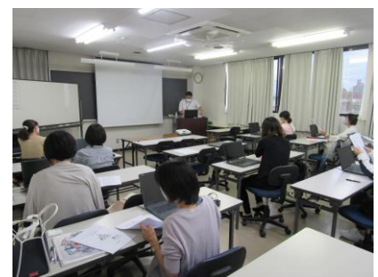
スキルアップ講座風景