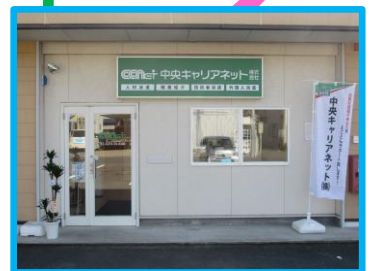
9月より開業の太田営業所