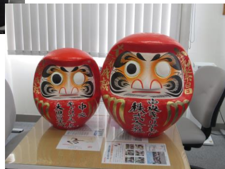
本社・太田2つのダルマが揃いました！！