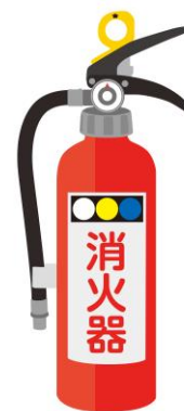
一度点検してみてください。